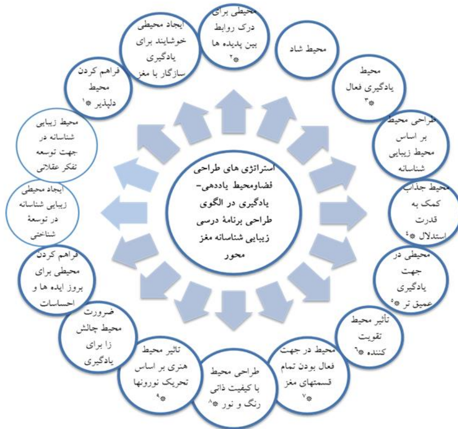
شکل ۱ تدوین استراتژی‌های فضا و محیط برنامه‌های درسی زیباشناسانه مغز محور