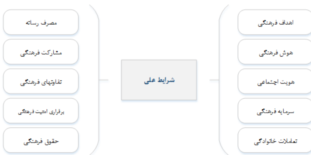
شکل ۱: شرایط علی پژوهش در خصوص شهروند فرهنگی

همچنین، بر اساس دیدگاه مشارکت کنندگان در مصاحبه مقوله‌های زیر به عنوان پیامدهای حاصل از شهروند فرهنگی شناسایی شده است. در جدول زیر ابعاد پیامدها، نشان داده شده است.